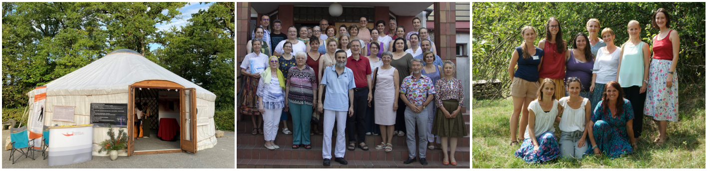
De izquierda a derecha: En la yurta se instalaron cabinas en las que se podían probar gratuitamente distintos tipos de masaje. ¡Nuestro sincero agradecimiento a las organizadoras! – Este verano volvió a celebrarse en Masloc, Rumania, un IPMT y el equipo organizador de Eslovaquia (foto de la derecha), preparó una experiencia intensa para los participantes. En ambos casos, se trató, por fin, de cursos presenciales.

rio, la preparación magistral concede más flexibilidad, permite producir de forma económica pequeñas cantidades, facilita la creación de una farmacia a nivel nacional y la introducción de medicamentos antroposóficos innovadores. Por este motivo, ambas formas de producción tienen su importancia y su justificación.