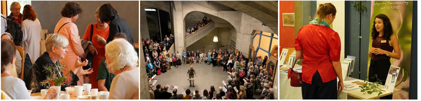
De izquierda a derecha: Las pausas se aprovecharon para conversar animadamente. – Un momento magnífico fue el canto matutino en la caja de resonancia de la escalera oeste. En el vestíbulo se podían visitar los stands de los laboratorios que fabrican los preparados de muérdago y de las demás casas farmacéuticas antroposóficas; también había mostradores de las asociaciones de médicos IVAA, VAOAS y GAÄD.

guaje común que haga posible la formación de una comunidad y haga que la interacción nazca del corazón.